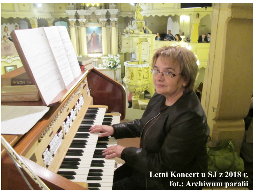
Letni Koncert u SJ z 2018 r.