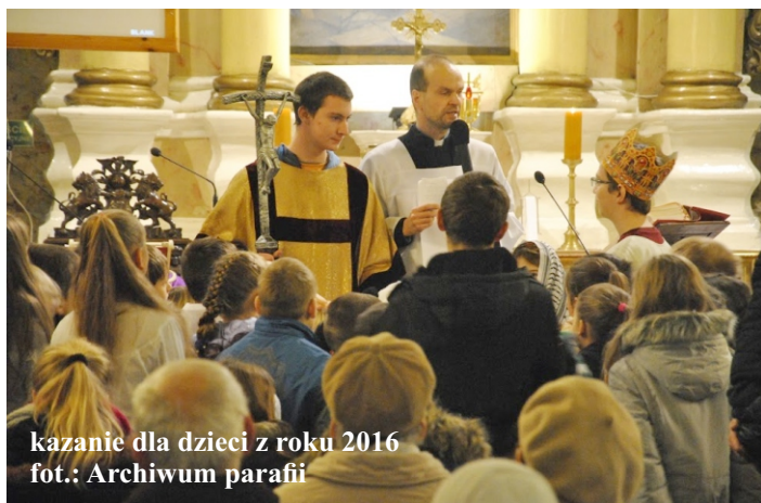
kazanie dla dzieci z roku 2016