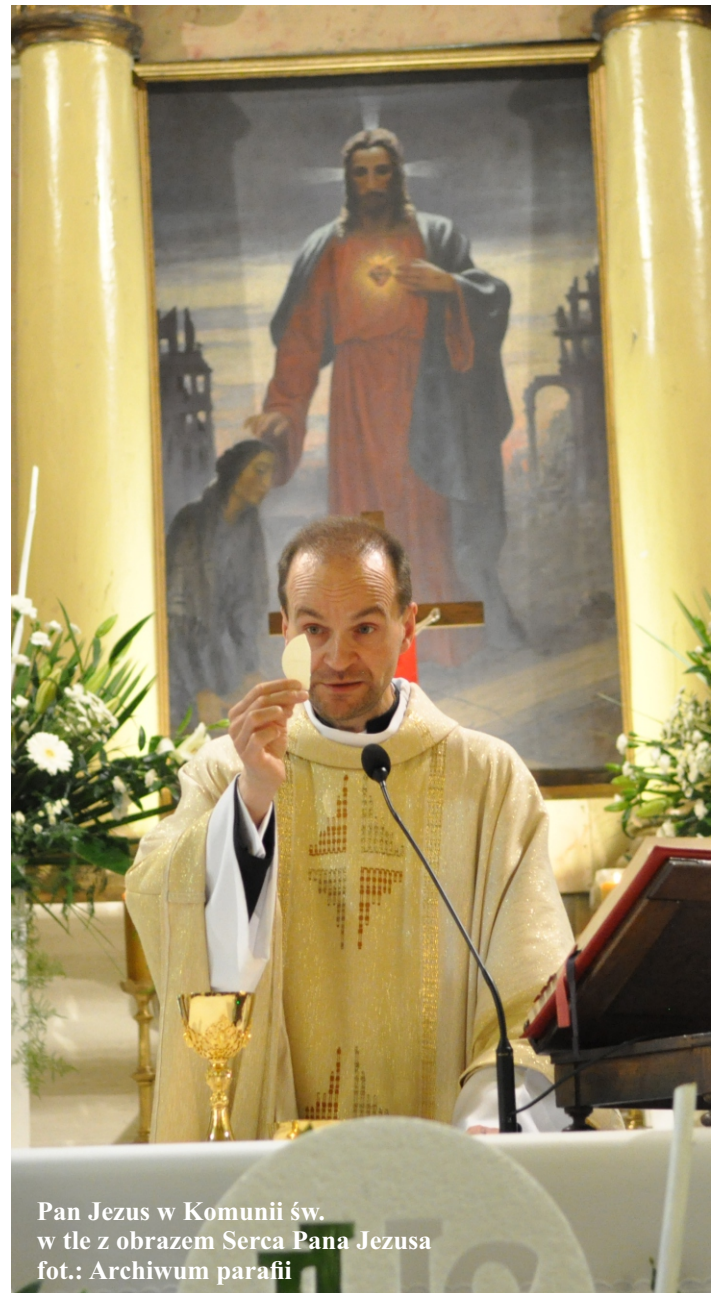
Pan Jezus w Komunii św. w tle z obrazem Serca Pana Jezusa

Nabożeństwo do Najświętszego Serca Jezusowego skłania również do aktów pokutnych za grzechy innych. Kto miłuje Boże Serce, ten będzie starał się temu Sercu wynagradzać za grzechy braci. Tak więc nabożeństwo to budzi także świadomość i odpowiedzialność społeczną. Nabożeństwo do Serca Jezusowego nagli do naśladowania