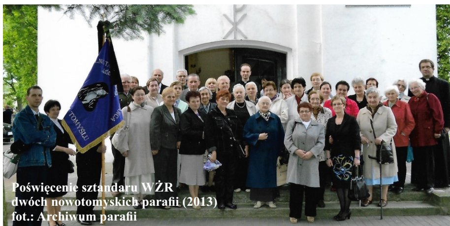
Poświęcenie sztandaru WZR dwóch nowotomyskich parafii (2013)