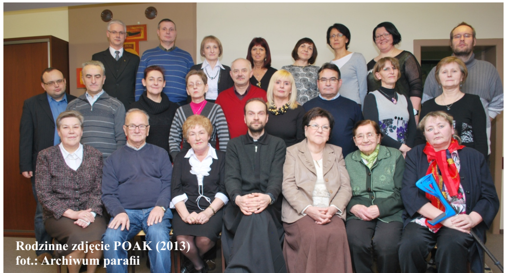
Rodzinne zdjęcie POAK (2013)

Projektem, który niestety się zakończył, była Akademia Serca Jezusowego w latach 2010-2013. Wielką popularnością cieszyła się wystawa fotograficzna „Oblicza kapłaństwa”. AK zorganizowała też wystawę fotografii z okazji kanonizacji świętych papieży Jana Pawła II i Jana XXIII pt: „Jego myśl w moim życiu”. Do działalności kulturalnej zaliczyć można także liczne pielgrzymki, które AK organizowała od 2002r. Spora liczba pielgrzymek dała możliwość poznania naszej pięknej Ojczyzny, tradycji i religii.