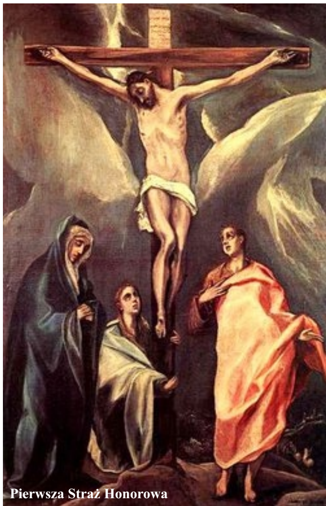
Pierwsza Straż Honorowa

Papież Klemens XIII podpisał 6 lutego 1765 roku dekret o ustanowieniu liturgicznego święta Serca Jezusowego na ziemiach polskich.