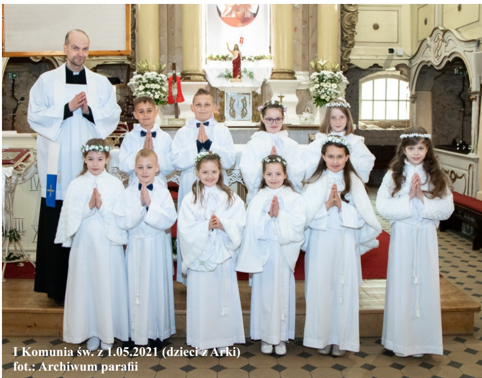
I Komunia św. z 1.05.2021 (dzieci z Arkki)

1. Opowiem Wam pewną historię, która działa się całkiem niedawno. Było to w Peru (Ameryka Płd.), a więc bardzo daleko od nas – ok. 11 350 km. W pewnym miasteczku mieszkała dość biedna rodzina, nie miała nawet na zapłacenie prądu. Ale jeden z synów bardzo chciał się uczyć i zostać prawnikiem. W domu nie było warunków, więc chodził codziennie do Centrum Miasta – pod latarnię, aby tam odrabiać lekcje i uczyć się! Oczywiście szybko to zauważono (w obecnych czasach wszędzie jest monitoring – w Polsce też) i wszystko poszło do sieci: historia małego chłopca, który wieczorami i to codziennie, przebywa na placu miasta pod latarnią i coś dziwnego robi! Tzn. uczy się! I w mieście było wielkie poruszenie. Władarze bardzo się tym zainteresowali. Załatwili podłączenie prądu do domu, aby chłopiec mógł się tam uczyć a nie chodzić na plac.