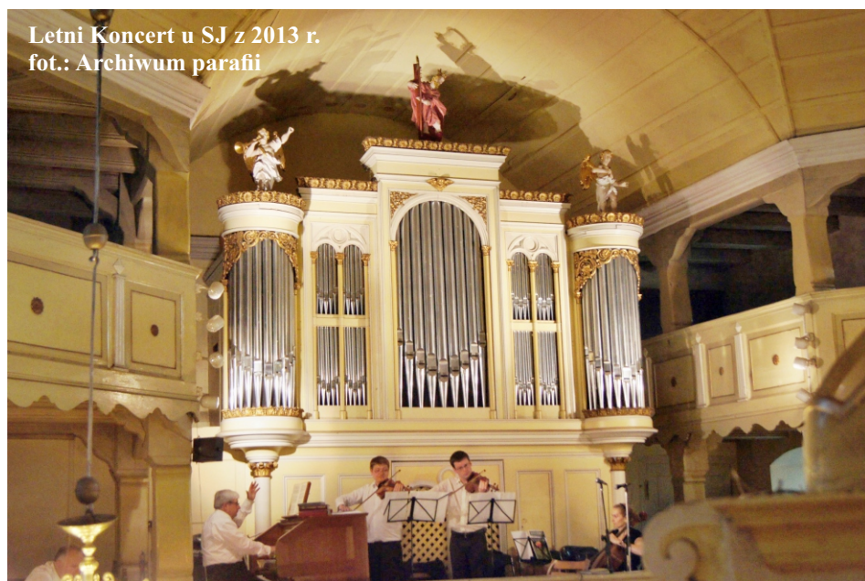
Letni Koncert u SJ z 2013 r.