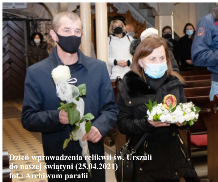
Dzień wprowadzenia relikwii św. Urszuli do naszej świątyni (25.04.2021)