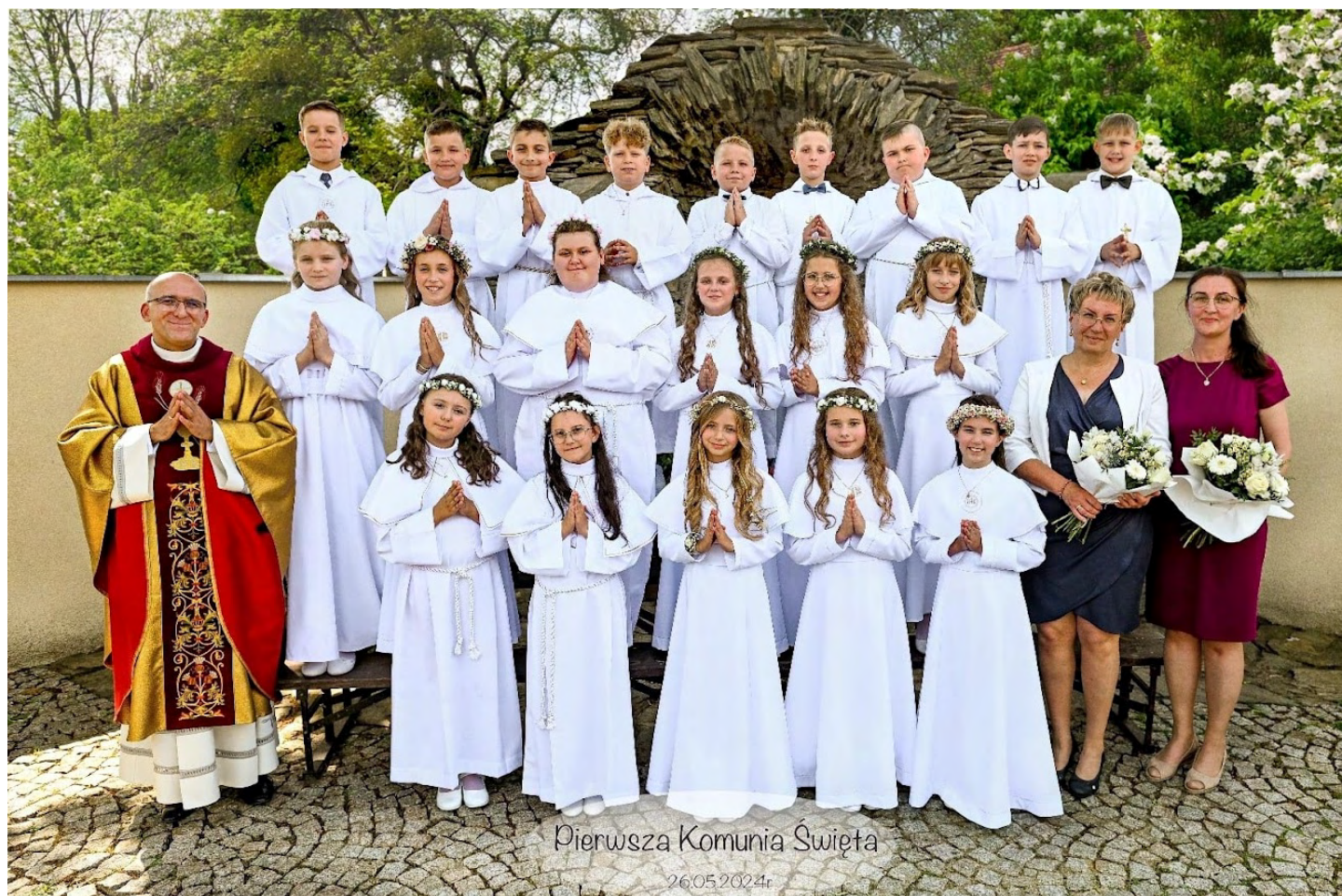
Pierwsza Komunia Święta