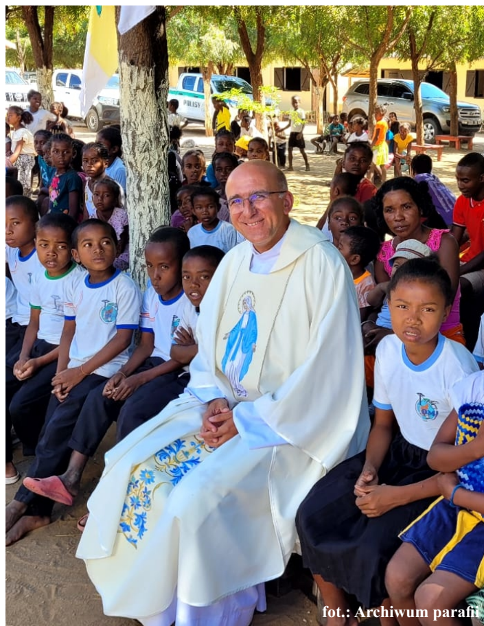
fot.: Archiwum parafii