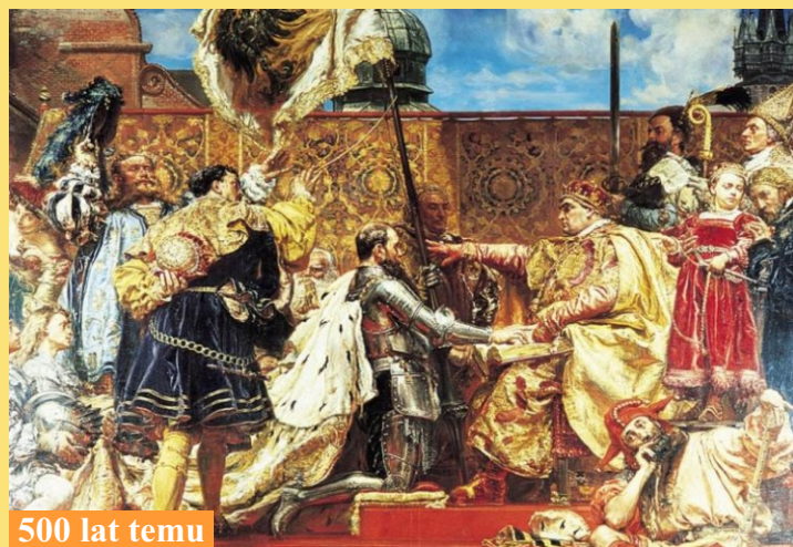
"Koronacja Bolesława Chrobrego" Obraz Sergiusza Buczackiego