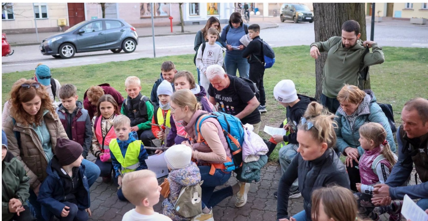
fot.: Małgorzata Smotrzyś